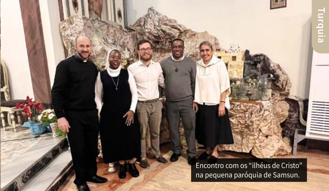
Encontro com os “ilhéus de Cristo” na pequena paróquia de Samsun.

A sua presença é um dom total, um despojamento radical ao serviço do Evangelho.