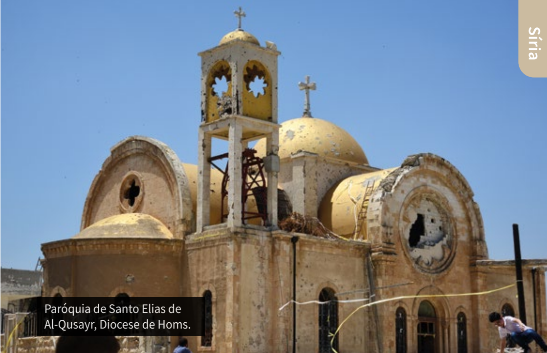
Paróquia de Santo Elias de Al-Qusayr, Diocese de Homs.

uma vontade de inclusão institucional. Foi também assinado, a 10 de Março de 2025, um acordo com as Forças Democráticas Sírias (FDS) de predominância curda, com o fim de integrar progressivamente as suas estruturas no seio do Estado sírio, uma etapa determinante no caminho da reconciliação nacional. Apesar destes avanços, a Síria continua fragmentada. No nordeste, a tensão entre o exército central e a FDS traduziu-se em preparativos de grande envergadura para potencialmente, desde Outubro de 2025, reconquistar Raqqa e Deir ez-Zor. Milhares de soldados terão sido colocados ao redor de Palmira, com o apoio de tribos árabes locais. Nas regiões costeiras e ocidentais, surgem insurreições de