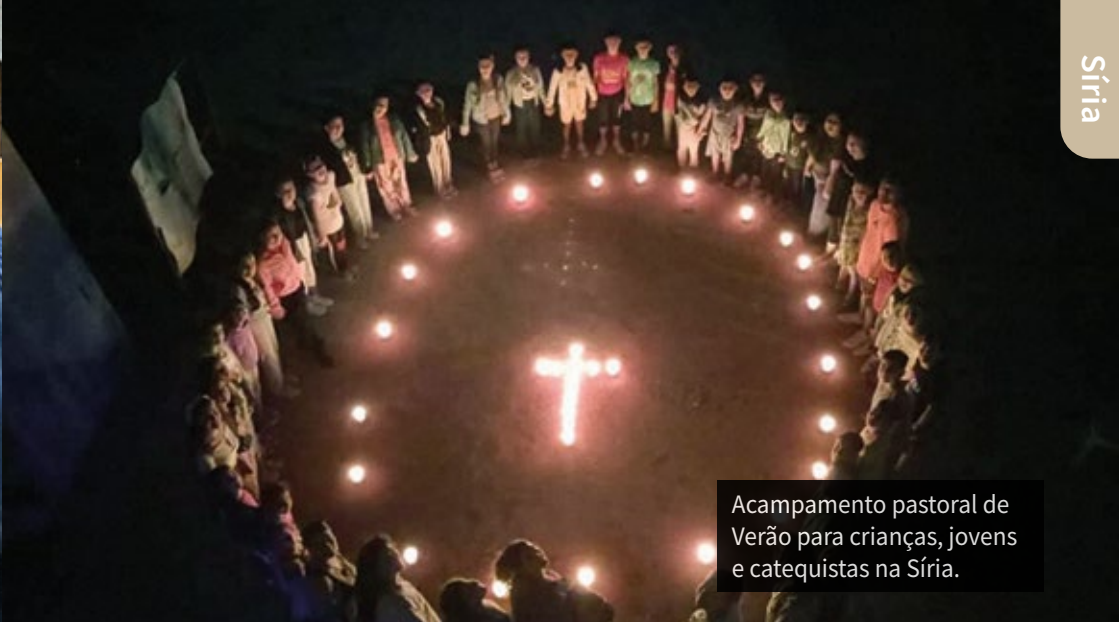
Acampamento pastoral de Verão para crianças, jovens e catequistas na Síria.

fonte principal da legislação, foi fortemente criticada pelas minorias – em particular a curda e a drusa – pela ausência de reconhecimento explícito da sua diversidade. Igualmente inquietante é a manutenção de 50 mil membros do estado islâmico e suas famílias, detidos em 27 campos do nordeste sírio. Estes estabelecimentos são regularmente alvo de tentativas de evasão, algumas bem-sucedidas, representando uma ameaça real à estabilidade futura do país.