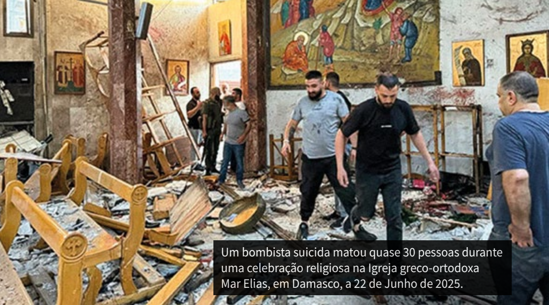
Um bombista suicida matou quase 30 pessoas durante uma celebração religiosa na Igreja greco-ortodoxa Mar Elias, em Damasco, a 22 de Junho de 2025.

uma orquestração do Governo actual, mas sim um grave fracasso do Estado em protegê-los eficazmente. A comunidade drusa, concentrada no sul (província de Suwayda), continua a ser vítima de violência. Os confrontos entre drusos e tribos sunitas, em Julho de 2025, causaram várias centenas de mortos e provocaram deslocações forçadas.