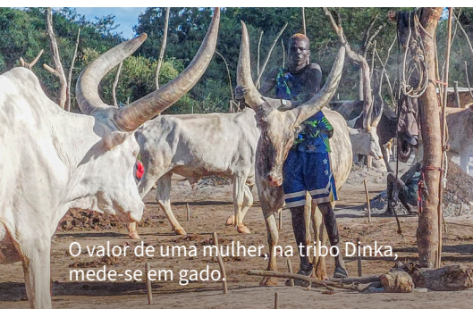
O valor de uma mulher, na tribo Dinka, mede-se em gado.

Os desafios para as famílias são imensos. Muitas pessoas têm estado em constante fuga durante décadas, incapazes de se estabelecerem ou de construir uma vida familiar estável. Os factores culturais agravam esta situação. O maior grupo étnico do Sudão do Sul são os Dinka, um povo nómada e pastoril que vive em poligamia. O valor de uma mulher é medido em gado. Quando uma família não pode pagar o preço exigido pelo casamento de um filho, uma das filhas é vendida em troca de gado. Este sistema provoca imenso sofrimento, como testemunhámos durante a nossa viagem.